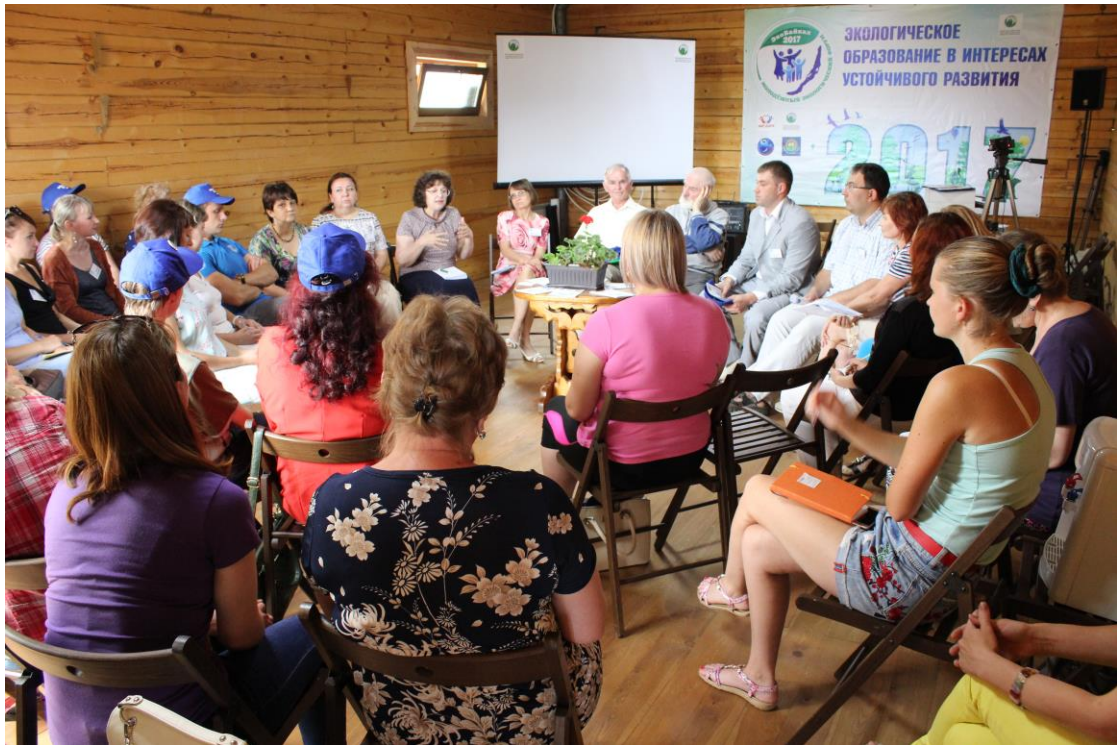
Участники круглого стола «Inter-Eco»

Были проведены мастер-классы по развитию метафорического мышления у молодого поколения, преодолению психологического выгорания, формированию стрессоустойчивости у опытных профессионалов.