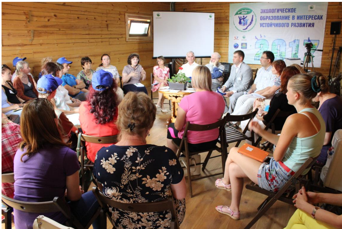
Участники круглого стола «Inter-Eco»

Были проведены мастер-классы по развитию метафорического мышления у молодого поколения, преодолению психологического выгорания, формированию стрессоустойчивости у опытных профессионалов.