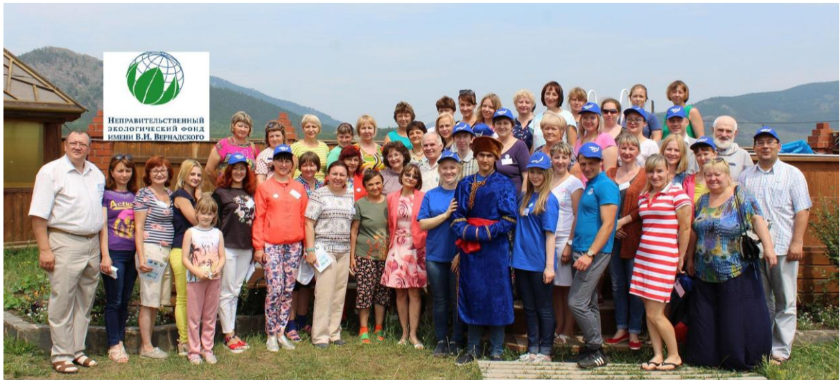
Участники межрегиональной байкальской школы «Эко-Байкал-2017»